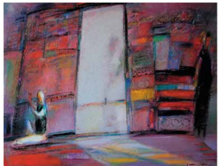
In the yurt (nomad's tent), 2009