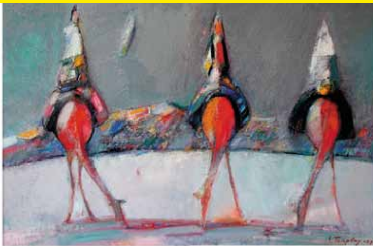
Three Graces, 2009

El mundo exterior, una fuente inagotable de imágenes, tramas y personajes, inspira la búsqueda creativa del artista. Representando objetos familiares y fenómenos en situaciones sencillas, ordinarias, Tolepbay busca reflejar su esencia interna, para aprovechar y hacerlo en los muchos estados que surgen de los constantes procesos de interacción e interrelación. Sin embargo, el lenguaje de la representación realista es inadecuado para expresar este tipo de fenómenos, debido a su sencillez excesiva. Como resultado de ello, las obras de Tolepbay se caracterizan por la estilización, la falta de información, el uso de las convenciones y una aspiración a abandonar referencia literal al medio ambiente circundante sin efectuar la separación completa de la misma, simultáneamente.