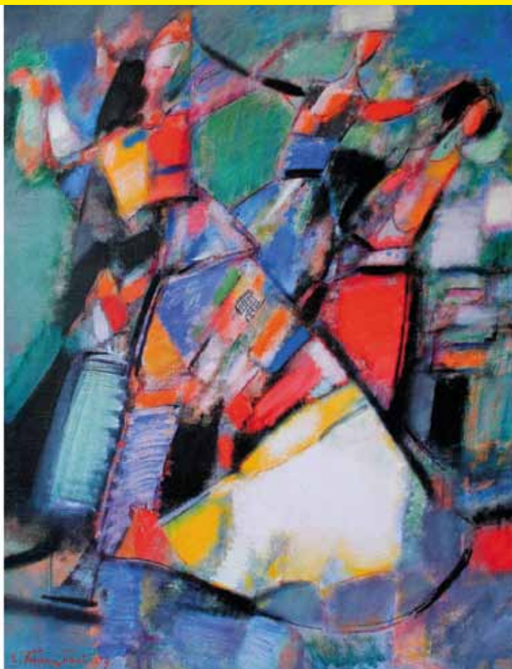
Dancing women, 2009

El tema y los personajes de las obras de Yerbolat Tolepbay expresan su personal interpretación de las imágenes, distinta de otras en la pintura moderna. Sobre la base de los grandes logros artísticos y las innovaciones del siglo 20, el artista se esfuerza por lograr introducir algo original y profundamente individual de los suyos. En su pintura, el artista está impulsado no tanto por la aspiración de expresar las experiencias emocionales y sentimientos, sino que es "sed de expresar sus propias ideas acerca de este mundo, obtenidas a lo largo de un camino de contemplación estática y agonizante."