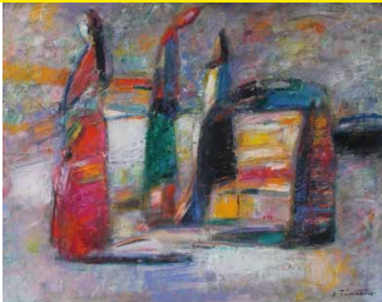
The Sky. The Earth. Women

Muchas de sus obras muestran la puerta de la yurta, que simboliza la transición a una realidad paralela. La puerta divide la composición en dos partes, permitiendo al artista presentar simultáneamente al espectador el interior y el exterior de la yurta. Estando a la vez en dos espacios diferentes, el espectador se sumerge en un estado de comprensión de una realidad simbólica a través de las imágenes del mundo físico concreto.