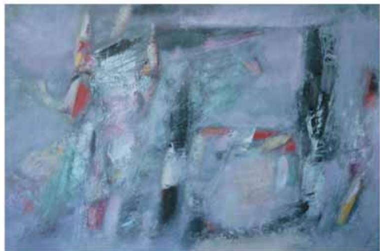
Life in the steppe, 2009